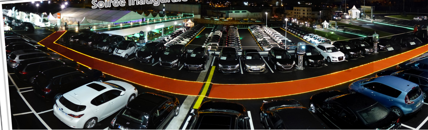
1300 m 2 de chapiteaux